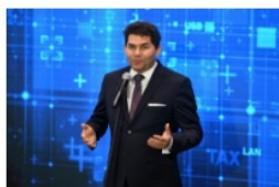
Lucjusz Nadberezny prezydent Stalowej Woli