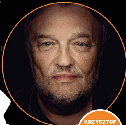
KRZYSZTOF CUGOWSKI z Zespołem Mistrzów 3.09.2023 godz. 20:30