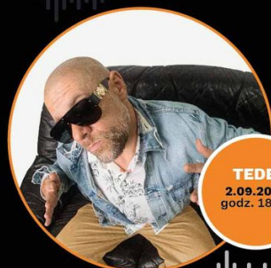
TEDE 2.09.2023 godz. 18:30