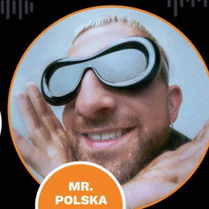
MR. POLSKA 2.09.2023 godz. 20:00

STREFA GASTRO STREFA PARTNERÓW MŁODZIEŻOWY ART PATROL STREFA AKTYWNOŚCI PARK ROZRYWKI