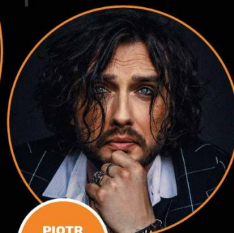
PIOTR CUGOWSKI 3.09.2023 godz. 19:00