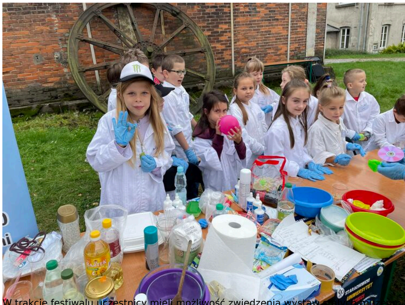
W trakcie festiwalu uczestnicy mieli możliwość zwiedzenia wystaw oraz odwiedzić Strefę Odkrywania Wyobraźni i Aktywności SOWA.