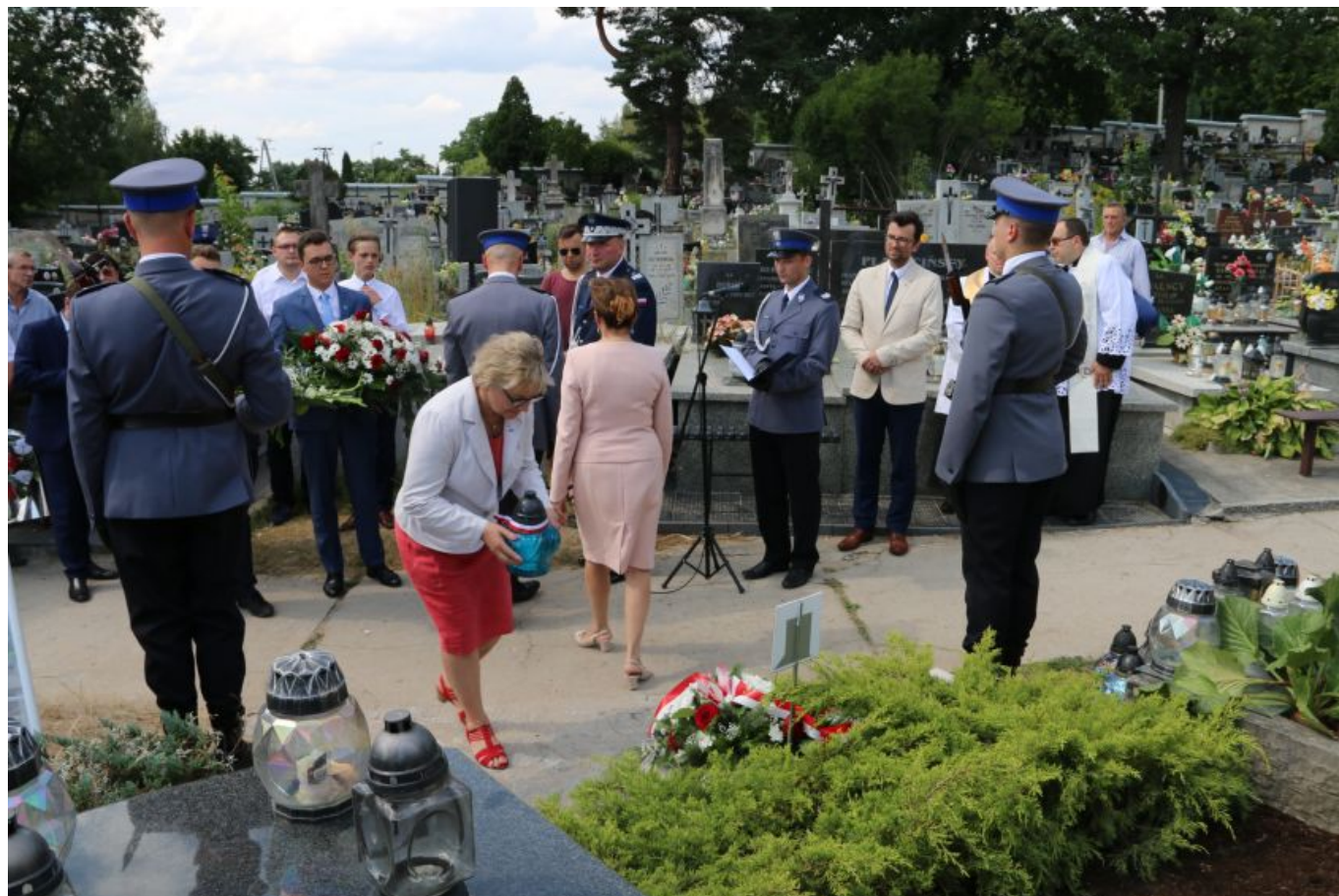
... delegacja Klubu Żołnierzy Rezerwy LOK ...