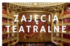
PROWADZI ZUZANNA KĘDZIORA