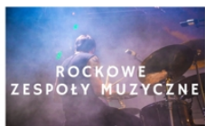
PROWADZI KRZYSZTOF STANIK