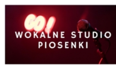
PROWADZI PIOTR MRÓZEK