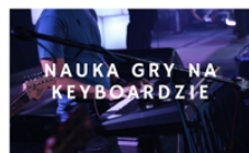
PROWADZI PIOTR MRÓZEK