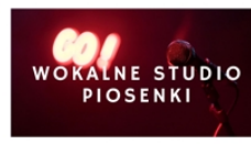
PROWADZI PIOTR MRÓZEK