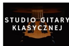
PROWADZI WALDEMAR DZIURA