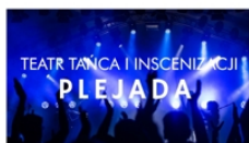
PROWADZĄ ALICJA ANDRZYKOWSKA KATARZYNA LIPIEC