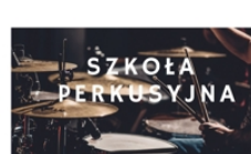
PROWADZI GRZEGORZ DZIAMKA