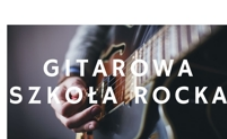
PROWADZI KRZYSZTOF STANIK