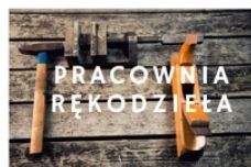
PROWADZI RADOSŁAW PŁUSA