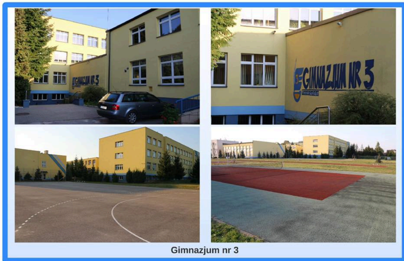
Gimnazjum nr 3