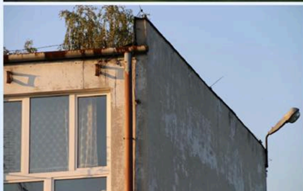
Zespół Szkół Zawodowych nr 3