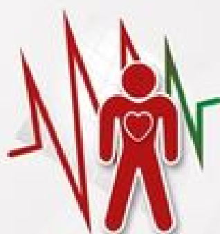
PRZYSPIESZONA CZYNNOŚĆ SERCA