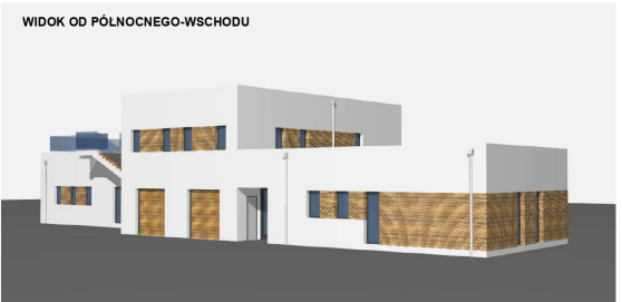
WIDOK OD PÓLNOCNOWEGO-WSCHODU