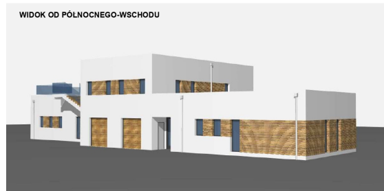
WIDOK OD PÓLNOCNOWEGO-WSCHODU