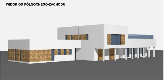
WIDOK OD PÓLNOCNOWEGO-ZACHODU