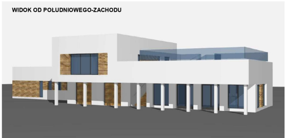
WIDOK OD POLUDNIOWEGO-ZACHODU