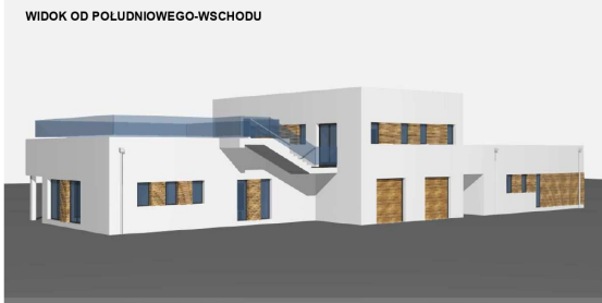
WIDOK OD POLUDNIOWEGO-WSCHODU