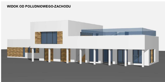
WIDOK OD POLUDNIOWEGO-ZACHODU