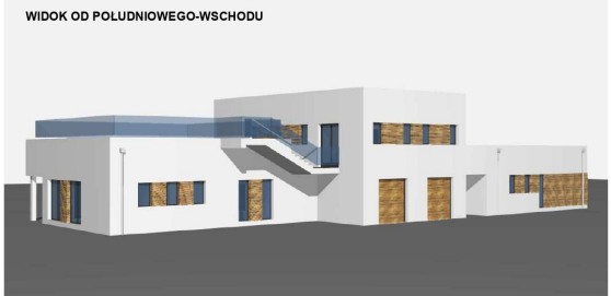
WIDOK OD POLUDNIOWEGO-WSCHODU