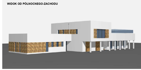
WIDOK OD PÓLNOCNOWEGO-ZACHODU